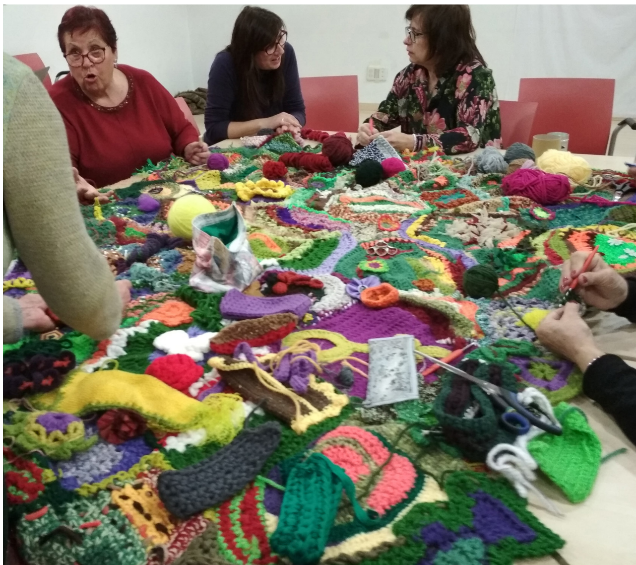
Tejer reúne. Y las manos ocupadas, libera la mente... y el habla.

La vestimenta se considera una segunda piel y seguimos buscando la forma de reapropiarnos de ello. Si la ropa forma parte de nosotros y nosotras, ¿no es una pena que sólo nos relacionemos con ella comprando y desechando? Hay numerosos tutoriales en youtube para customizar ropa y cada día hay más interés de las personas por recuperar técnicas textiles tradicionales, a la par que surgen interesantes iniciativas que conectan lo artesanal con las posibilidades abiertas por las nuevas tecnologías de fabricación digital. Es un mundo creativo tremendamente experimental.