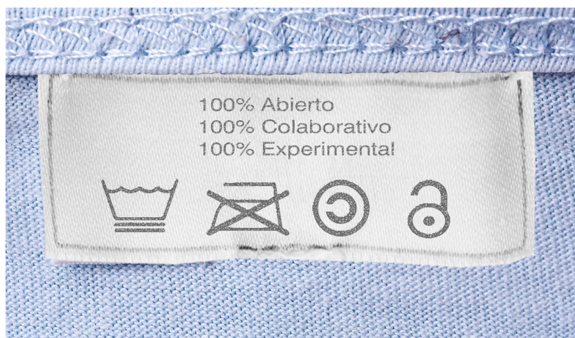
Es hora de que la colaboración sea un valor en moda.

En esta guía os mostraré los "ingredientes" y "pasos" que considero cruciales para montar un taller textil abierto, horizontal, intergeneracional, sostenible y crítico con los estereotipos de género y por todo ello... innovador. No ha sido fácil redactarla pero espero que os sea útil. Recordad que lo más importante es que disfrutéis de lo que estáis haciendo.