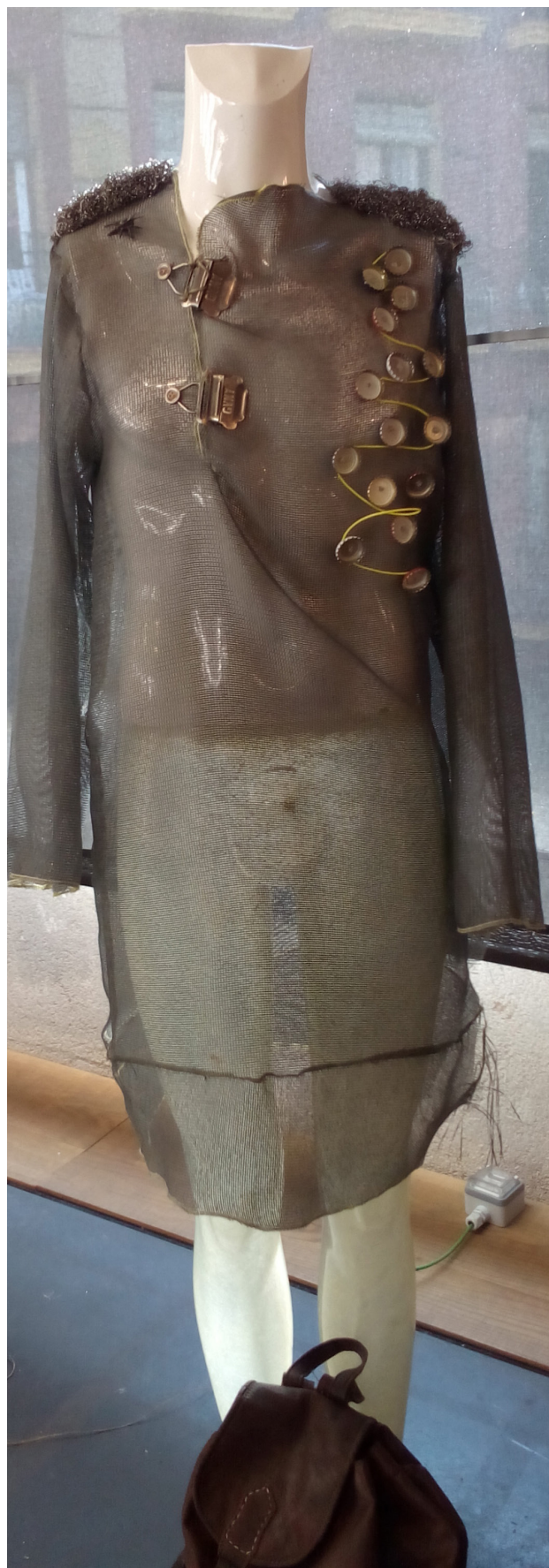
Prueba a hacer prendas con materiales inusuales. De Elisabeth Lorenzi con licencia CC BY-SA 4.0

¿Dónde y cómo publicar? Puedes hacerlo a través de páginas de redes sociales, creando una web... y, por qué no, publicando tu propia revista o fanzine. Para esto último necesitas prestar atención a la maquetación y conseguir una línea editorial que le dé continuidad (cabecera, tipografía, etc...).