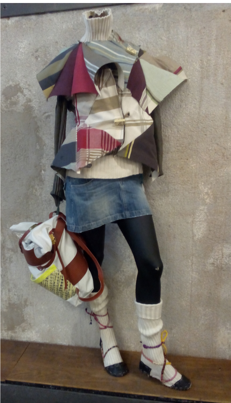
El reciclaje textil no tiene límites. Explóralos.

Una vez que vuestro taller ha tomado forma, busca el apoyo de entidades, de tiendas, de profesionales, profesores... Y a su vez apoya otros proyectos desde las actividades realizadas en el laboratorio textil. Podéis organizar eventos invitando a gente de otros proyectos (por ejemplo un swap o un desfile). Cuanto más invitéis a otros proyectos, más invitarán al vuestro a participar en sus propios eventos.