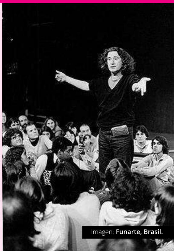
Imagen: Funarte, Brasil.

Ilustración: Wikimedia Commons, Luis Alvaz.